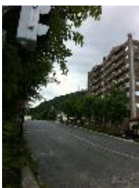
図 5 実行結果の画像（その 3）

実行すると、やはり演習 1 と同じように画像を表示します。ウィンドウが選択された状態で、キーボードのスペースキーを押すとプログラムが終了します。プログラムと同じフォルダを調べて見てください。図 5 に示すように、横幅が 100 ピクセルで元画像の縦横比を維持したままの高さになっています。