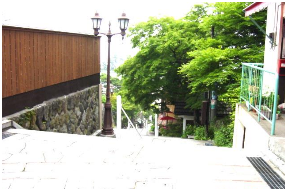
図3 実行結果の画像（その1）

今度は、プログラム中の変数 rate を1より小さな値に設定してみましょう。図4は rate を0.5に設定した実行した時の画像です。全体的に暗くなっているのがわかります。