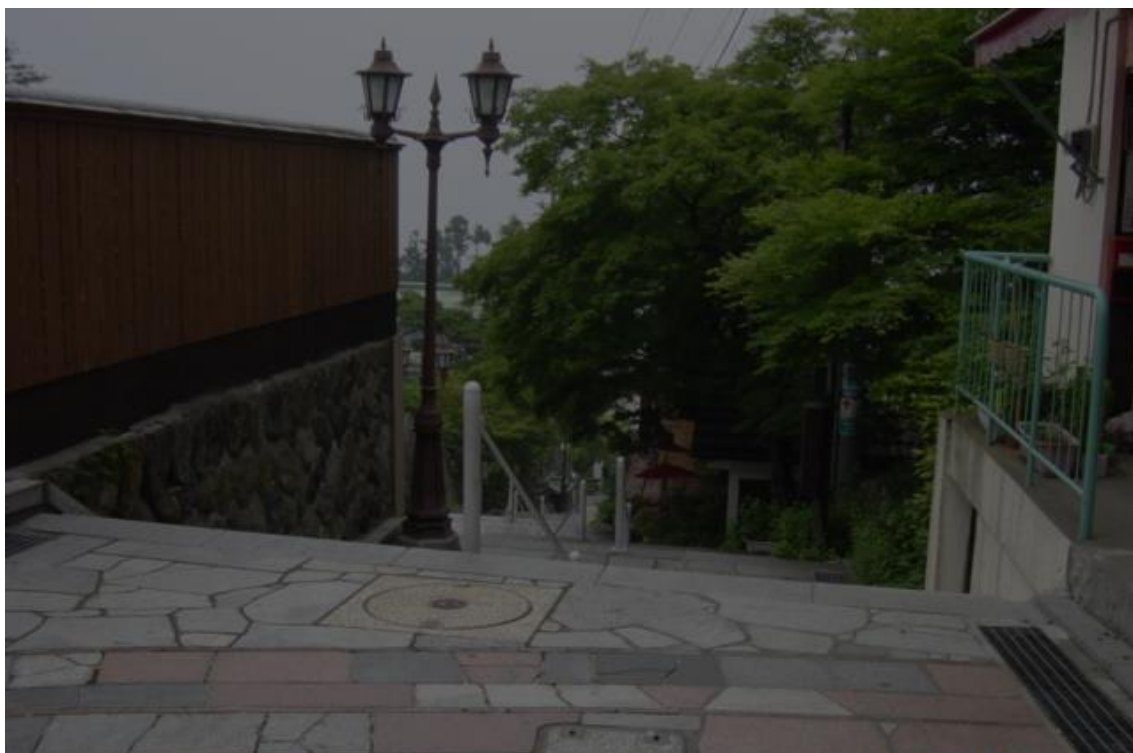
図4 実行結果の画像（その2）