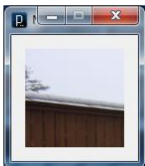
図 1 実行画面（その 1）

これは、デフォルトで縦・横それぞれ 100 ピクセルのウィンドウが表示されたために、画像の一部しか表示できていないのです。画像全体を表示するために、プログラムを以下のように書き換えてみましょう。